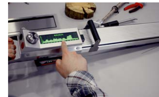
Interpretation der Messkurven